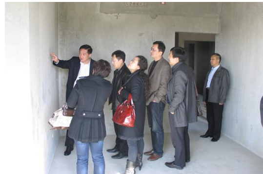
参观中南 NPC 建筑展示